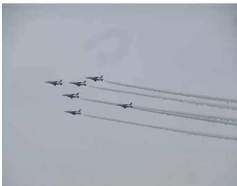
観衆を魅了したブルーインパルス。

地上では太鼓演奏や警備犬の訓練展示も行なわれ、キッズトレインなど子ども向けの企画も。大人から子どもまでが楽しんでいました。