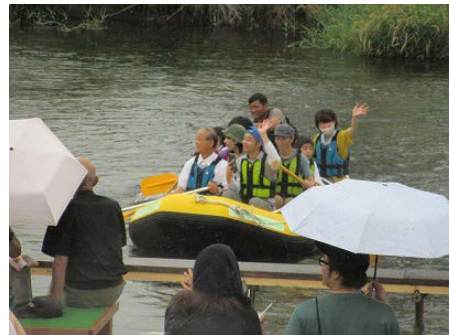
ラフティングを楽しむ来場者。会場には涼を求める市民が訪れました。

「チトセリバーシティブロジェ クト・チトセ未来EXPO」は千 歳青年会議所が主催し、観光連盟 が後援。清水町親水広場を会場に、 千歳川を下るラフティングや川遊 び企画で千歳が誇る清流に多くの 家族連れが親しみました。世界の 食を提供する出店や、ごみを燃料 に動く「デロリアン」も登場。来 場者にごみ分別への協力も求める など、環境を意識したイベントと して定着しています。