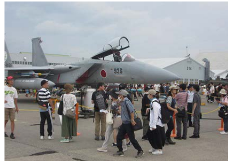
地上では航空機も展示されました。

航空自衛隊千歳基地による「ちとせのまちの航空祭」が7月30日、同基地で開かれました。松島基地所属のブルーインパルス6機による曲技飛行が観衆を魅了したほか、F15戦闘機や政府専用機の迫力ある飛行展示が訪れた人を圧倒。基地には多くの航空ファンが詰めかけました。