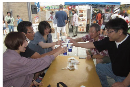
ビールを手にして「乾杯！！」 待望の夏到来です。

初日は大雨に見舞われたため、同実行委には観光連盟も加わり、開催に協力しています。