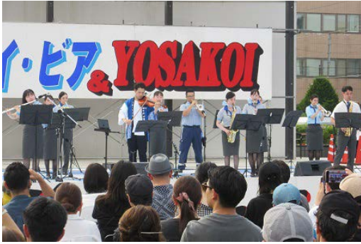
「チトセ・アンサンブル・カント」がステージで華麗な演奏を披露しました。

で観光スポットや特産品をアピールし、物販も実施。ブースでは各地の産品を買い求める人の列ができました。