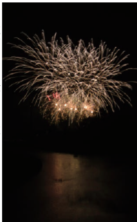
3000発の花火が打ち上げられ、千歳の夏の夜空と千歳川を華麗に彩りました。