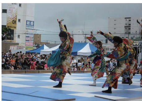
勇壮なヨサコイ演舞が会場を盛り上げました

千歳市民夏まつりの幕開けとなる、「スカイビア&YOSAKOI祭2023」が15～17日、千歳市内グリーンベルトで開かれました。冷たいビールで喉を潤しながら、街中で繰り広げられる勇壮かつ華麗なヨサコイ演舞を楽しむ市民であふれました。ステージでは交流都市のプロ