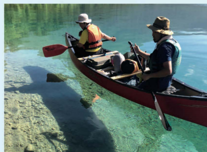
カヌーでのごみ回収