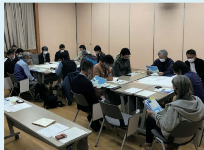
支笏湖の適正利用の検討に関する会議の開催