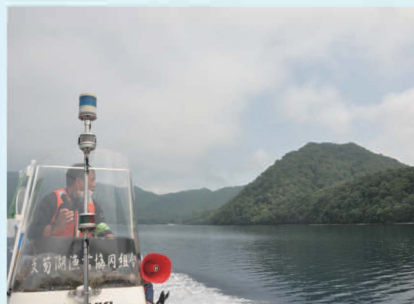
エリアパトロール