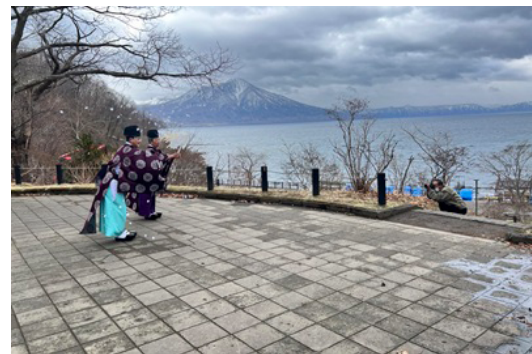
神事で無事故・無災害を祈願

国立公園支笏湖運営協議会（事務局支援・観光連盟）の主催。神職が祝詞を奏上して無事故・無災害を祈願。関係者が祭壇に玉ぐしをささげて、観光シーズンの平穏と地域振興を神前で願いました。支笏湖神社に設けられた祭壇には供物が並び、「支笏湖の観光シーズンの扉を開ける鍵」という意味があり、湖水開きを象徴する鍵のミニチュメントも置かれました。