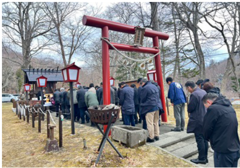
関係者が列席した安全祈願祭

支笏湖観光の今シーズンの開幕を告げる支笏湖湖水開き・安全祈願祭が4月12日、支笏湖温泉園地内の支笏湖神社で執り行われました。支笏湖ビクターセンター近くの神社に祭壇が設けられ、地元関係者ら約30人が出席。シーズン中の無事故無災害、行楽客の千客万来を祈願しました。