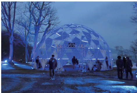
ドームやライトアップされた木々が来場者を幻想的な世界へと誘いました

観光連盟が事務局を支援する、国立公園支笏湖運営協議会主催。春を迎えて観光シーズンが本格化