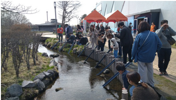
水族館近くの小川で稚魚を放流する参加者

サケのふるさと千歳水族館で、毎年春恒例のサケ稚魚放流体験が行われています。休日には親子連れや観光客が水族館近くの小川に稚魚を放し、海への旅立ちを見送っています。 サケの生態や成長、千歳川とサケの関わりについて関心を持ってもらう狙いで毎年開催しています。学習室でサケの生態について学んだ参加者は、スタッフから体長5センチほどに成長したコップを受け取り、小川に設けられた「滑り台」のように切った筒でコップの水とともに流すようにして、稚魚を放流しました。小さな子供が稚魚に手を振り、「いってらっしゃい」と見送る姿も見られました。